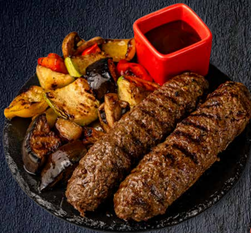
Люля Кебаб из говядины