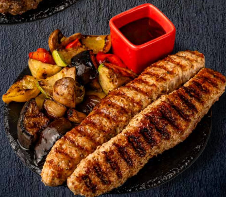
Люля Кебаб из курицы