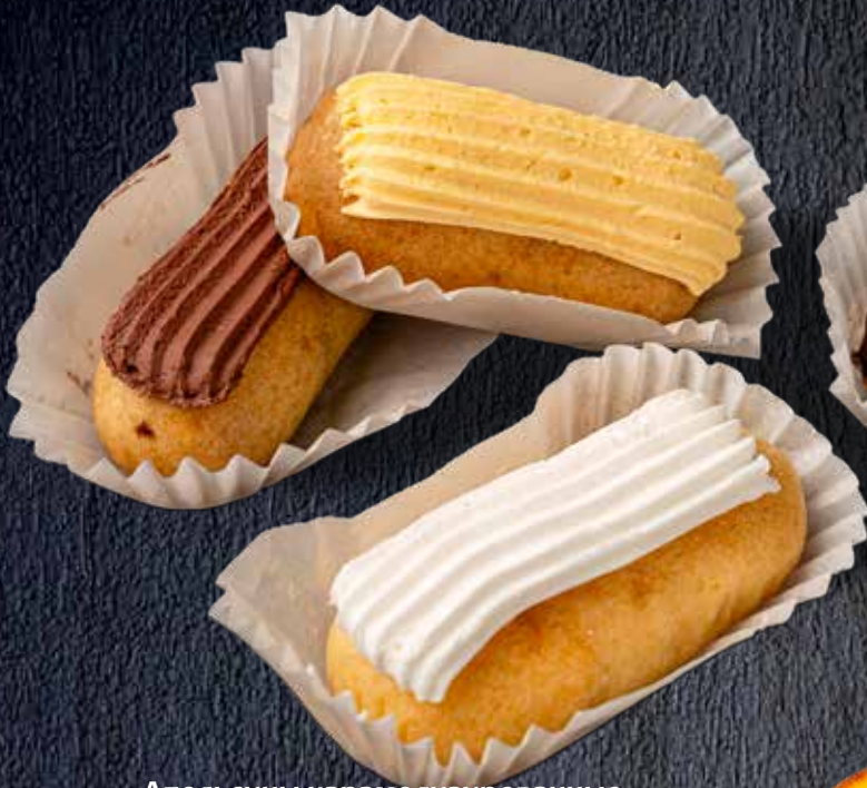
Мини эклеры в ассортименте