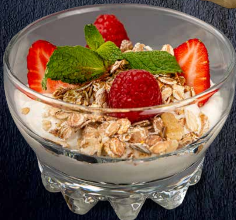
Гранола с йогуртом и клубникой