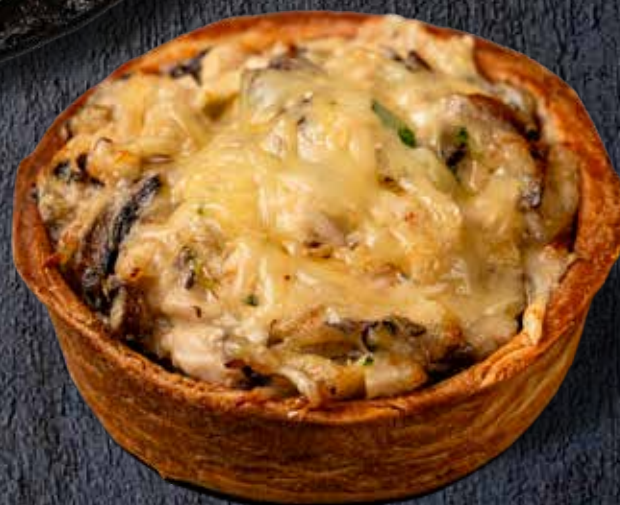
Мини киш с овощным ротатюем