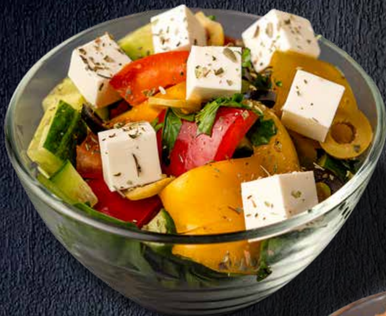
Классический салат “Греческий”