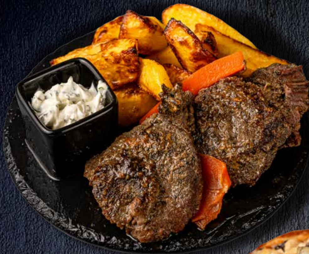
Щёчки говяжьи в соусе Деми Гласс