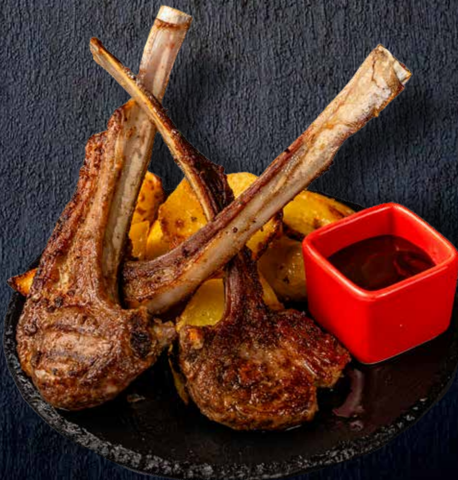
Карэ ягнёнка в травах