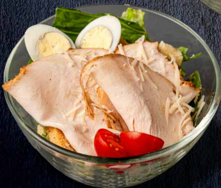
Классический “Цезарь” с курицей