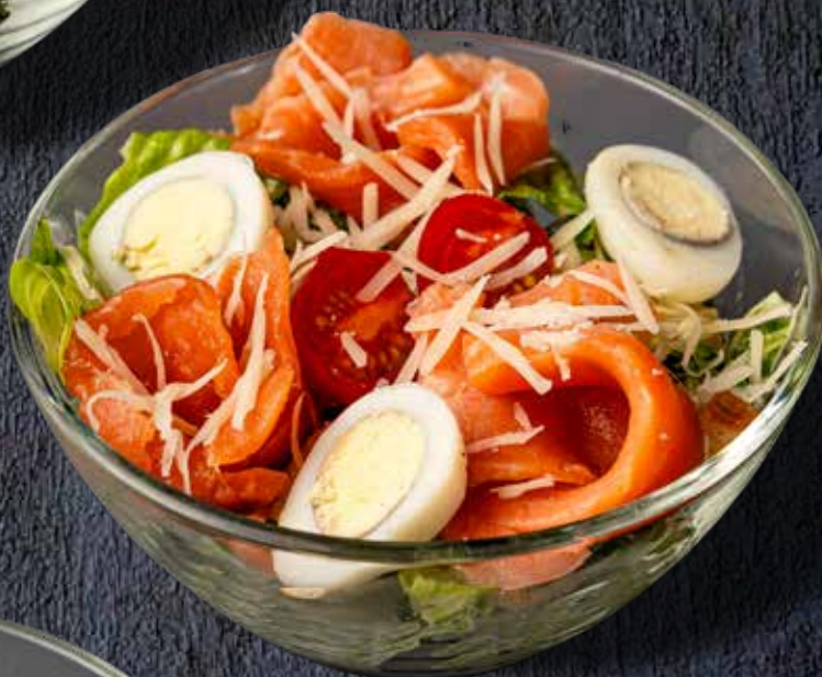
Классический “Цезарь” с сёмгой