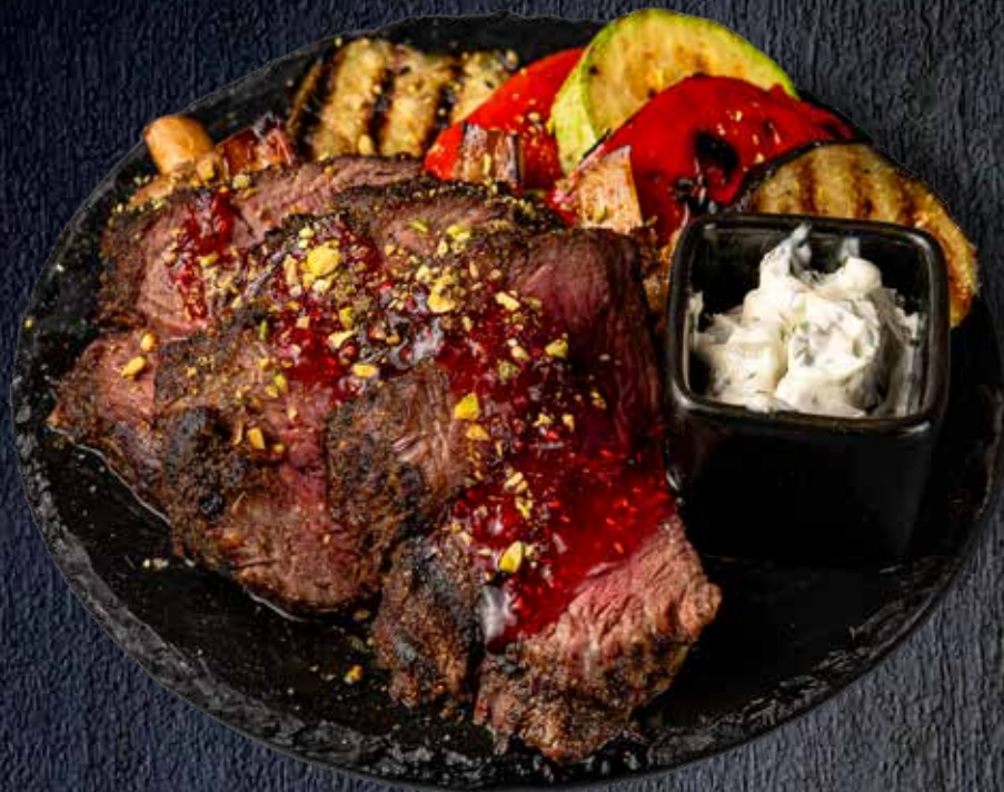
Ростбиф в клюквенным соусом